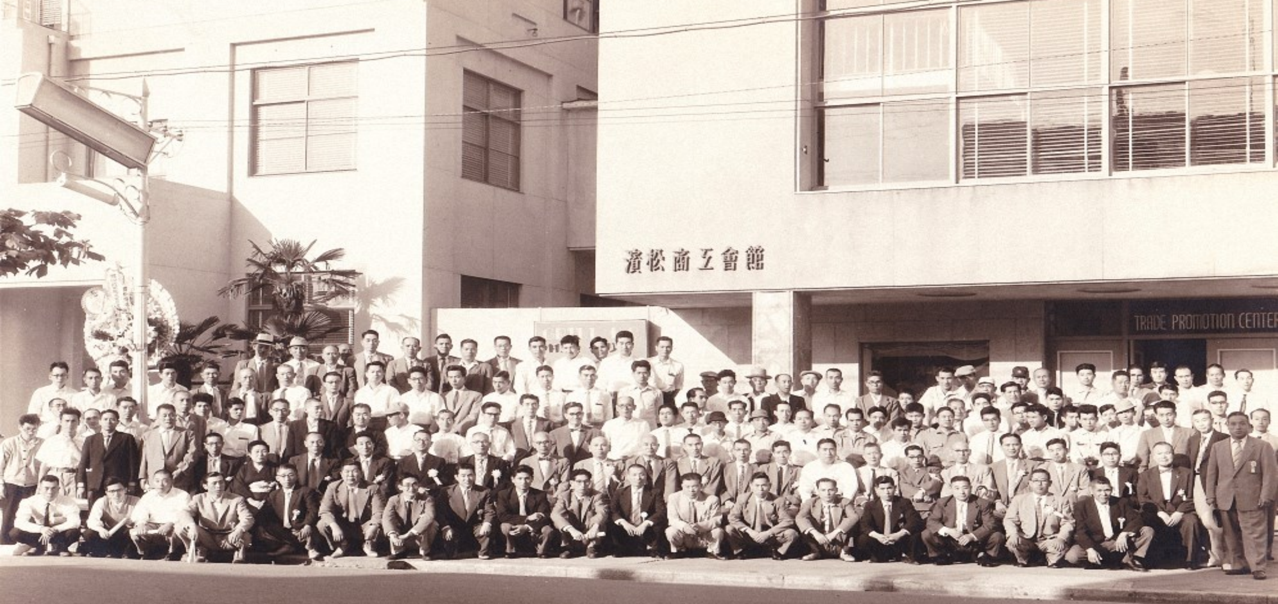
設立総会后商工会館前での記念撮影